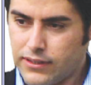
دیدیگەلێك سەبارەت بە "دەربارەى عەقلى ئازاد" ی بەختیار عەلى