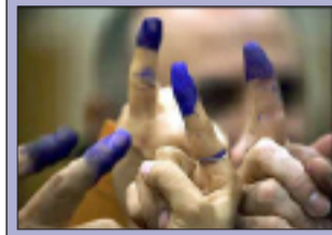
خەلك بېهوا بووه لە حكومەت و بەرپرسان

تایبەت بە ههولاتی: دواى هەره‌شه‌کردنى موچه برین لە فەرمانبەران پەرلەمانتاریکی گورد بەپێویستی دەزانیت حکومەتی هەرێم لەرێگەى پێشکەشکردنی پرۆژەى خزمەتگوزاری و داڕێژکردنی دادپەروەرییەو، هانی خەلك بەدات بۆ سەردانیکردنی بنکەکانی دەنگدان نەك هەرەشەو ترساندن. چاودێرانى سیاسیش جەخت لەو دەكەنەو كە دیموکراسی لەبەغدا زیاترە وەك لەكوردستان و ئەوێش وایكردووە كە ئەمەریكا زیاتر پشتگیری حكومەتی ناوەند بكات. دواى ئەو هەرەشەو درێژكردنەوێ وادی تۆمارکردنی ناوەكان بۆ دووجار، تائیسنا لەكۆى نزیكەى دوو ملیۆن و