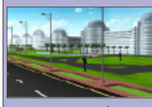
شارى غاز ئەو پرۆژەيەى هیندەى ۱۰٪ ی رووبەرى بەغداد دەبیت