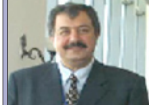
كوردستان و لە دەستدانى پوسە نەتەوەییەكانى