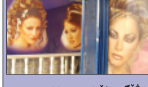
بەشیكى زۆرى مووچەى ئافرهتان بۆ ئارایشتكاكەنه